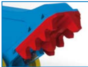
CRP PLATE VERSCHLEIßPLATTE CRP