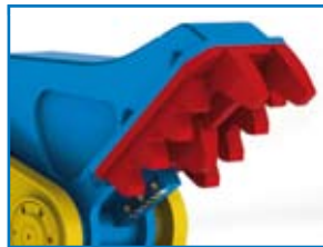
PP PLATE VERSCHLEIßPLATTE PP

Mantovanibenne launches its new series of dedicated Rotating Pulverisers. This equipment is particularly effective for primary and secondary demolition, being suitable for high reach and regular applications. The 360° rotation makes a particularly accurate demolition tool for complete or partial building demolition. The RP IT range are fitted with a power valve to give maximum power when required and increase cycle times when no load is applied.